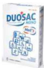
SACCHETTO FREDDO - CALDO