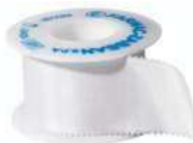
CEROTTO SU SETA