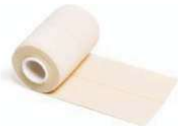
BENDA ELASTICA ADESIVA FORTE 6 8 10 cm