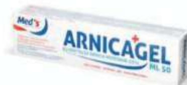
ARNICA GEL 30% 50ml