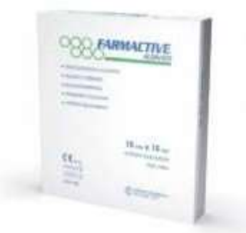
MEDICAZIONE ALGINATO DI CALCIO