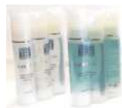
SIERI: JALURONICO COLLAGENE DNA VITAMINICO