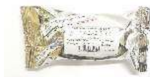
BENDA OSSIDO DI ZINCO