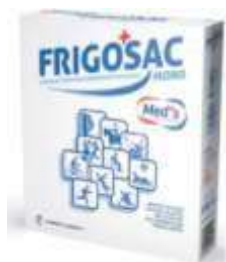
GHIACCIO SECCO ISTANTANEO