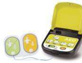
DEFIBRILLATORE ADULTO E PEDIATRICO