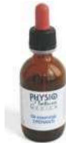
OLI ESSENZIALI: DRENANTE RILASSANTE TONIFICANTE TERMOATTIVO