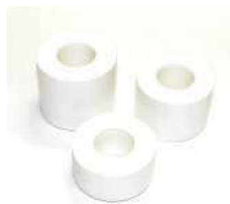
TAPE 2,5 3,8 5 cm