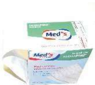
MEDICAZIONE ADESIVA IN STRISCIA