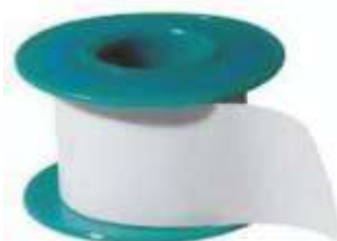
CEROTTO IN TNT