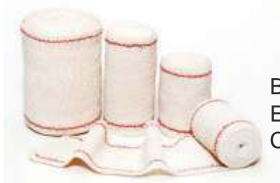
BENDA ELASTICA COESIVA