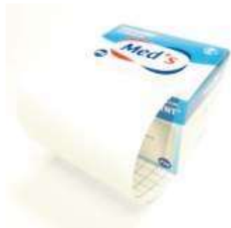
CEROTTO TNT ADESIVO