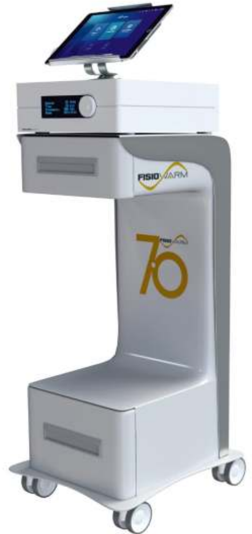
FISIOWARM 7.0 400